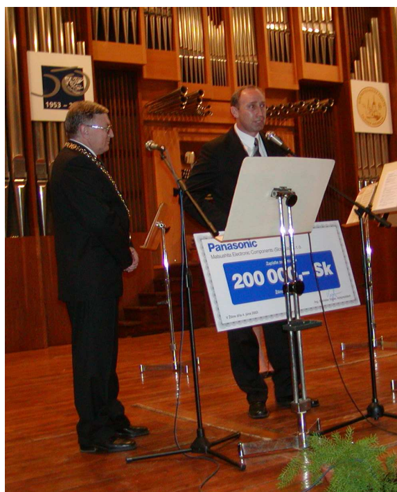
Otvorenie slávnostného večera a hlavný sponzor