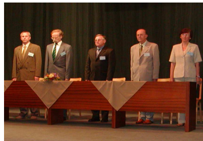
Otvorenie stretnutia absolventov KRIS