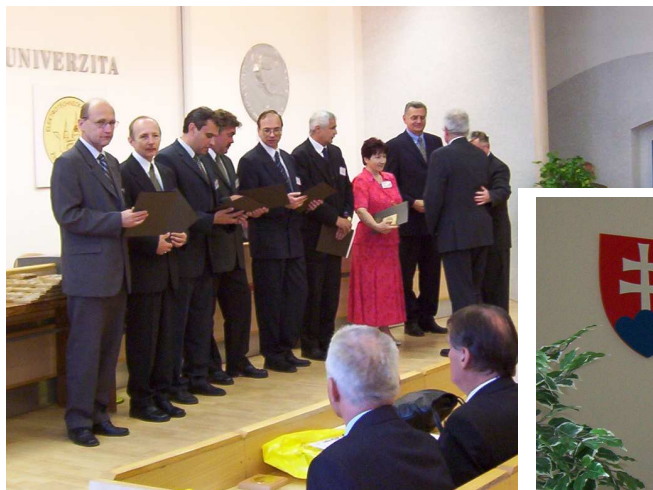
Zo slávnostného odovzávania ocenení: „Striborných medailí Elektrotechnickej fakulty a Žilinskej univerzity“ v aule NG-01 počas vedeckej konferencie EF