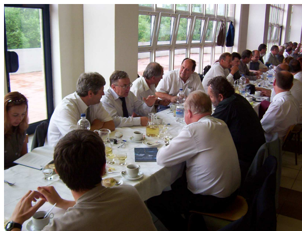
Z odovzdávania ocenení na stretnutí absolventov KVES a slávnostná recepcia v priestoroch Novej menzy ŽU.