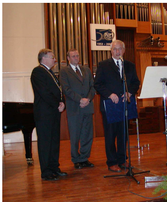
Odobrávanie certifikátu kvality podľa ISO 9001