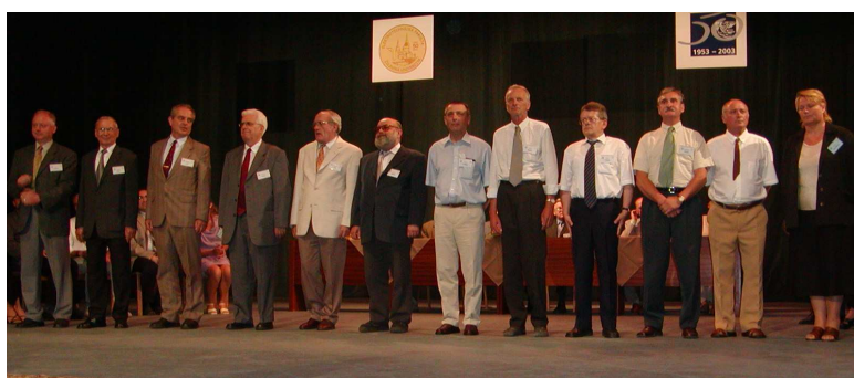
Odovzdávanie „Bronzových medailí EF a ŽU“

Recepcia tohto podujatia sa uskutočnila v hoteli Slovakia, kde mali bývalí absolventi príležitosť na neformálne rozhovory a mohli si pozrieť výstavu starých fotografií z rôznych podujatí katedry. Pre záujemcov bola v skupinách zorganizovaná exkurzia do laboratórií katedry na Veľkom diele.